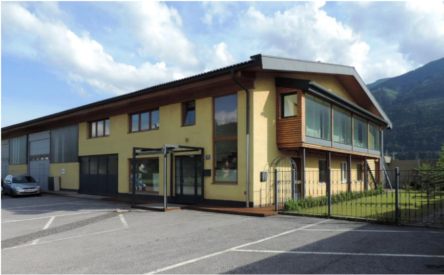
Bild: Unser Wasser-Produktions-Gebäude in A-9800 Spittal an der Drau (noch in miete)

Die SOLIDEO Genossenschaft wurde am 20.06.2013 in Muttenz mit Sitz in Reinach Kanton Basel Land von 7 Personen gegründet. Der Eintrag im HR-Register erfolgte mit der Nummer CH 280.5.016.968-3.