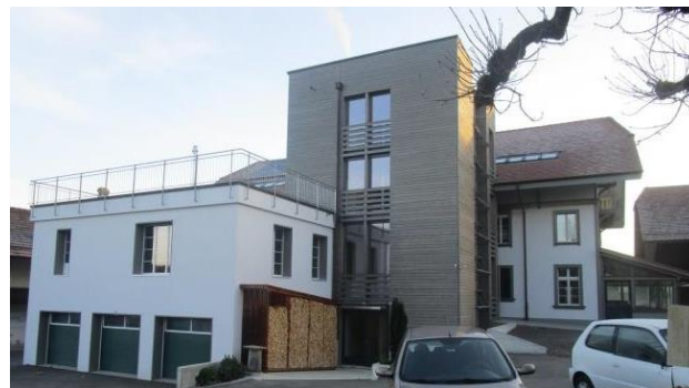
Restaurant OCHSEN in CH-3255 Rapperswil, Hauptstr. 42