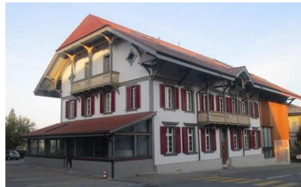
Restaurant OCHSEN in CH-3255 Rapperswil, Hauptstr. 42

www.human-weg.net E-Mail: hjk@euroweg.net